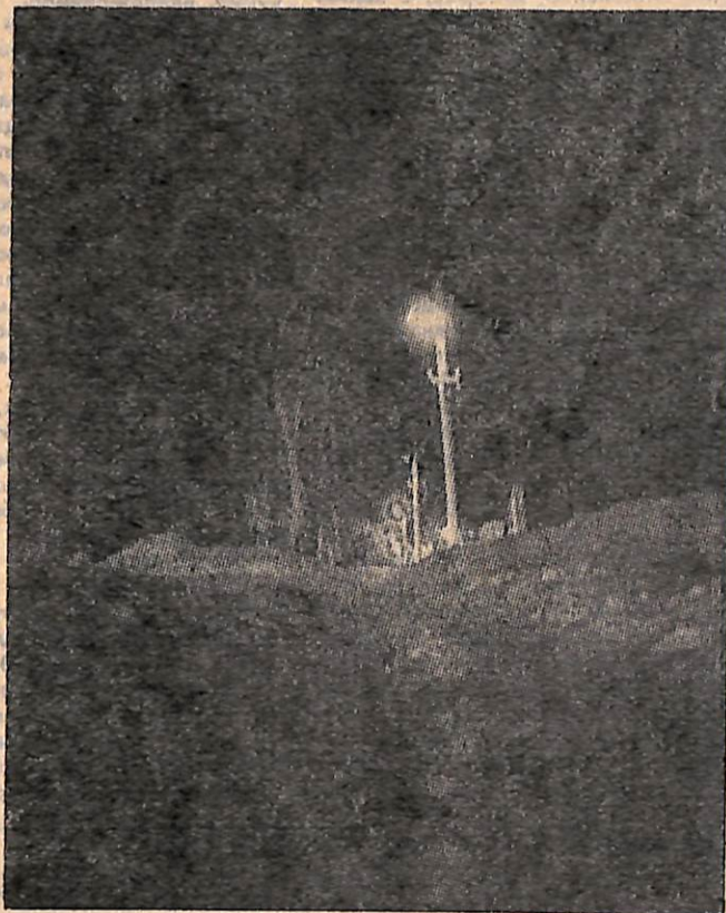
«Зимний вечер».